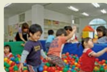
おもいきり遊んでくださいね♪

子育て中の親子が楽しく遊びながら、他の親子との交流や情報交換ができる場です。センターには保育士がいますので、子育てについて、困っていることや不安なことなど、お気軽にご相談ください。