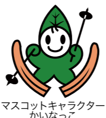
マスコットキャラクター かいなっこ