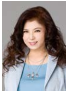
▲ 八代 亜紀

入場申込 郵便往復はがきの 往信用裏面に、①郵便番号②住所③名前④電話番号、返信用表面に、①郵便番号②住所③名前を記入し、次のあて先までお申し込みください。