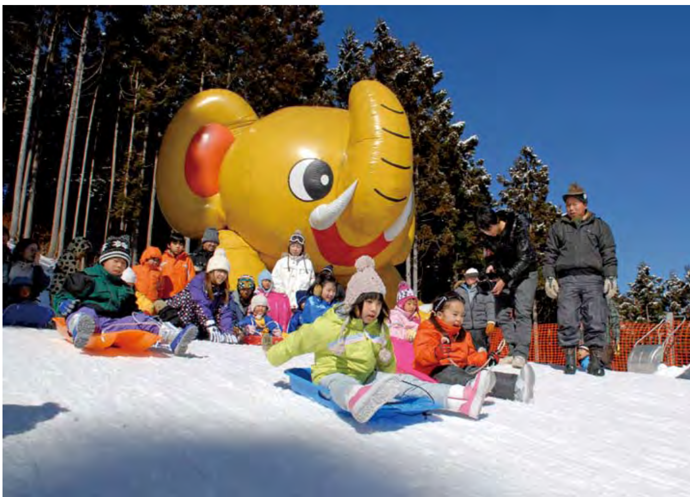
第23回ふれあい雪まつり in 腕山