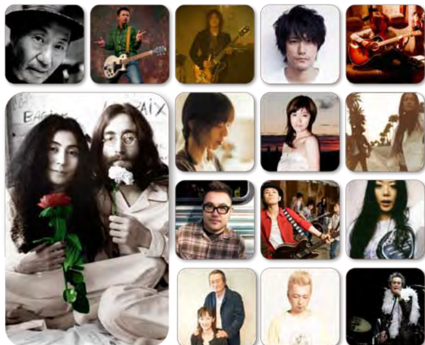
John & Yoko

「世界の恵まれない子どもたちに学校を贈ろう」をテーマにジョン・レノンの命日に行われたチャリティ・ライブの様相をオンエア!