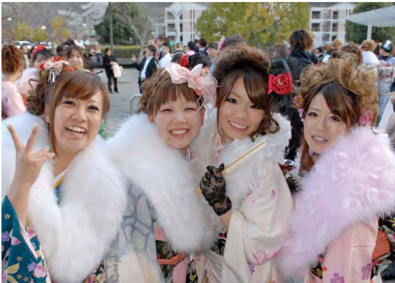
平成 22 年三好市成人式