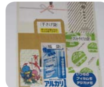
包装紙、カレンダー、紙袋