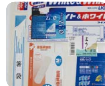
いろいろな商品の紙箱