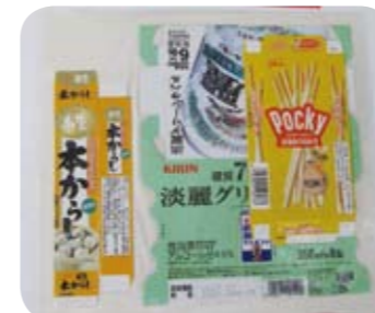
食品、お菓子の紙箱