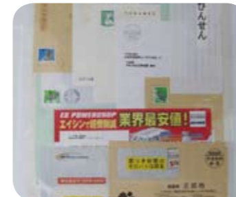
封筒、はがき、DM ※個人情報排出者の責任で