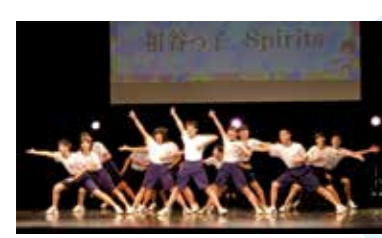
東祖谷中学校 祖谷っ子 Spirits (1年生・2年生) 第4回全国小・中学校 リズムダンスふれあいコ ンクール全国大会出場

「昨年は自分らしい走りができず悔しい思いをしました。今年の夏と秋にある全国大会に出場して悔しさを晴らすために、今日もがんばっています」