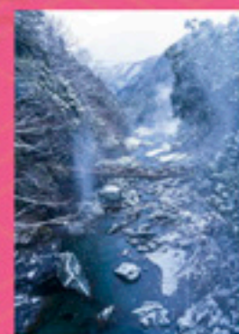
令和二年度 インスタグラム部門 佳作 「響のかずら橋」 maro_nagaishi

三好市の自然景観、文化財、伝統芸能、イベント、お祭り、街並みなどを感性豊かに表現した観光写真をご応募ください。 四国のほぼ真ん中に位置する三好市は、四季折々の表情を豊かに見せる山並みや、変化に富んだ渓谷美などの美しい自然に恵まれ、各地域には風土に根ざし伝統・伝説に彩られた個性豊かな景観が形づくられています。中心部にある池田町は、昔たばこ産業で栄え、今なお、うだつのある家が立ち並ぶ歴史と文化を持ち合わせた情緒ある町です。そこから少し足を運ぶと四国屈指の観光地である祖谷のかずら橋・奥祖谷二重かずら橋、刺山固定公園、国定名勝・天然記念物の大歩危峡・小歩危峡などがあり、年間を通じて多くの観光客の人気を集めています。昨年度、第8回「千年のかくれんぼフォトコンテスト」には、応募作品総数：1848点（プリント部門：392点 インスタグラム部門：1456点）のご応募を頂き、今年度も継続して、第9回「千年のかくれんぼフォトコンテスト」を開催致します。三好市の自然景観、文化財、伝統芸能、イベント、お祭り、街並みなどを感性豊かに表現した写真をご応募ください。お待ちしております。 徳島県三好市