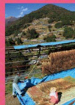
令和二年度 プリント部門 特別賞 「そば屋とし」 藤本 正樹