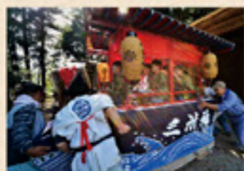
令和二年度 プリント部門 入賞 「祭りの子守」 森江 正