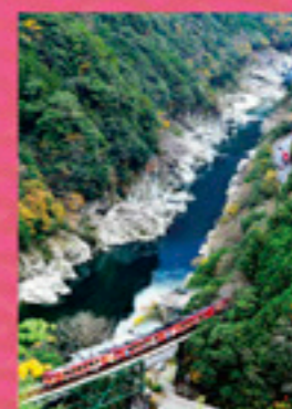
令和二年度 プリント部門 佳作 「瀬原を渡る」 向井 暁