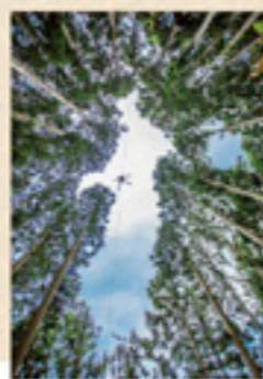
令和二年度 インスタグラム部門 入賞 「空中瀑布」 every222