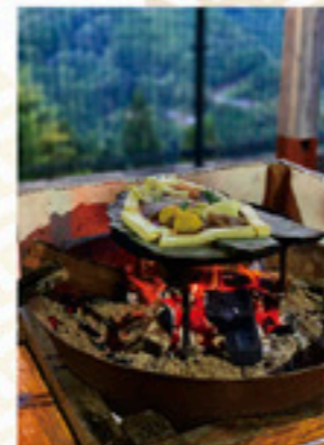
令和二年度 インスタグラム部門 特別賞(グルメ) 「福島の農村で楽しむ、美味..ひらら焼き」 miss_qiari