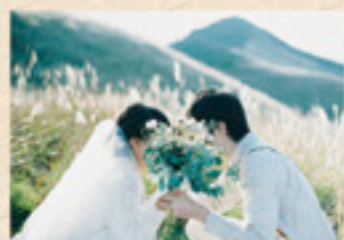
令和二年度 インスタグラム部門 特別賞(ポートレート) 「Swear love in Shionaka peak」 smy1...A