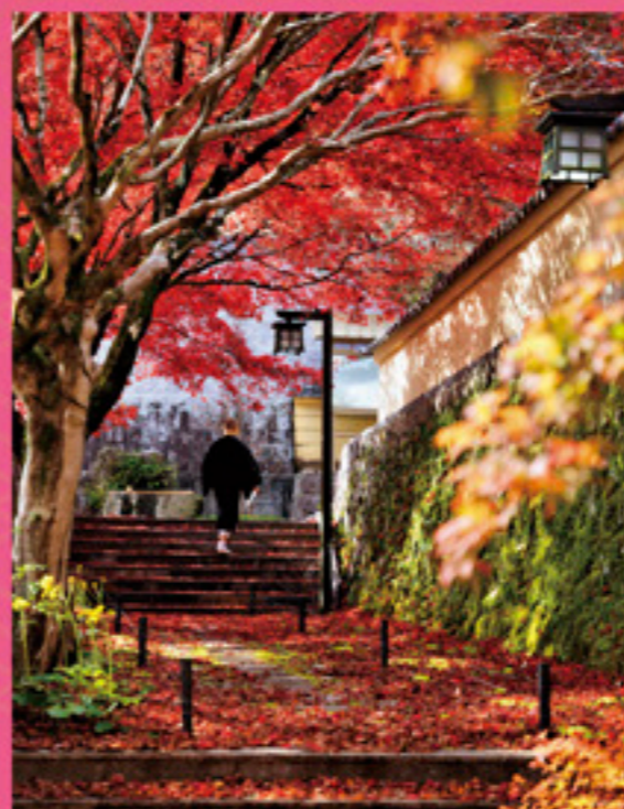
令和二年度 インスタグラム部門 最優秀賞 「奥に染まる山寺」 akira_1972