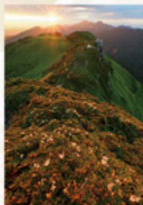
令和二年度 インスタグラム部門 入賞 「朝日を浴びて」 kagewasin01

千年…ゆっくりと流れる時の経過、その中に刻まれた歴史、伝統、文化が、先人たちの 叙智の結晶として暮らしの中に今もなお息づく。 かくれんぼ…その地形により閉ざされた空間、誰もが覗いてみたい神秘的な魅力。 懐かしさ、秘めやかなさ、優しさ、純真さ。