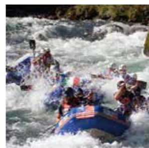
ウォータースポーツ推進事業