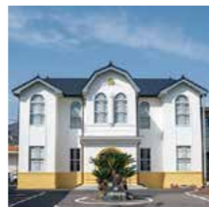
旧三野町役場庁舎活用整備事業