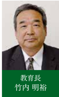
教育長 竹内 明裕