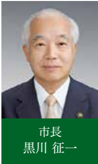
市長 黒川 征一