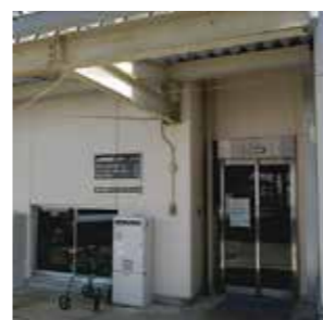
山城身体障害者デイサービスセンター建設移転事業