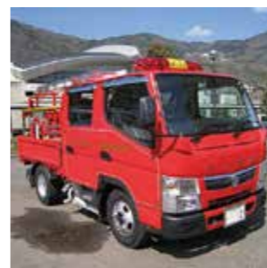
消防自動車購入事業