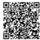
アイネットホームページ