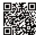
児童手当制度のご案内