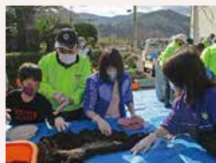
総合的な学習の時間補助-小学校