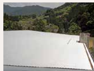
地域多目的施設修繕