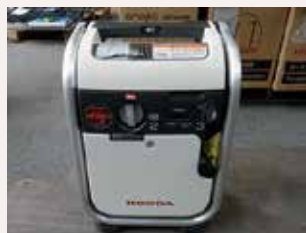
避難所用必需品の購入