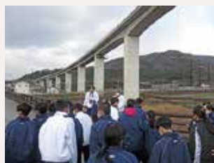
総合的な学習の時間補助-中学校