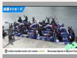
ウォータースポーツ PR 動画