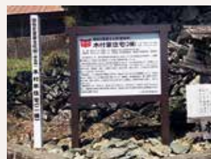
文化財説明看板の設置