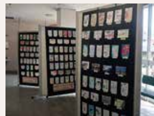
はがきアートプロジェクト