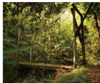
八枚なべら入り口の釣り橋

「梅雨の三好」 皆さん、ご無沙汰しております。お元気ですか。今年花便りも早く、季節の移ろいも早く感じます。そろそろ梅雨に入るのではないかと、梅雨は日本や中国など、東アジア地域特有の気象現象です。梅雨に入ると、ジメジメして、洗濯物がなかなか乾かないし、じっとしていても汗が出てベタベタするので、子どもの頃は、この時期が好きではなかったです。 歳を重ねるにつれ、雨の風情もだんだん好きになってきました。秘境の景色は、晴れの日は清々しい眺めですが、雨の中では刻々と変化する絵巻物のようになります。雨の中では、吉野川の流れや大歩危・小歩危、祖谷の山々や集落は、格別に幻想的な雰囲気を感じ出し、別世界の桃源郷へいざなってくれる。雨に洗われた大自然の姿は色鮮やかで、生き物たちも生き生きとします。有名なかずら橋や落合集落はもちろんのこと、梅雨の三好ならではの、塩塚高原のアジサイ、松尾川の本タル、有宮神社の苔、黒沢湿原の眺めもおススメです。 三好市に住んで3年目になりますが、最近ようやく八枚なべら