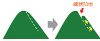
図1: 山頂の凹地（線状凹地）のでき方

この線状凹地は、もともと二つの尾根だった部分が、重力によって形が変化し、多重の稜線を形成してできたものです。つまり、これらの池は山頂部分が崩れた