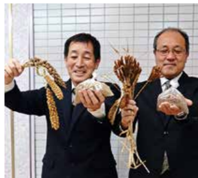
登録されたヤツマタなどの雑穀

昭和46年旧井川町議会議員に当選以来、5期20年間の長きにわたり在職し、町議会議長や副議長などの要職を歴任され、豊富な経験と卓越した見識と行動力を生かし、地方自治の発展と地域振興、住民福祉の向上に貢献をされました。