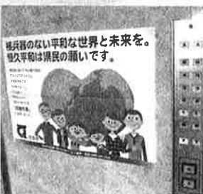
市庁舎4階議会EV横にあるポスター

核兵器禁止条約が昨年1月22日に発効し、「核兵器は違法」とする国際法が誕生した。日