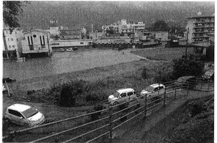
2014年8月豪雨時の池田町シマ地区 雨量 三好市池田336ミリ 異常気象は地球温暖化の影響か？

昨年12月議会、最終日に「ゼロカーボンシティ宣言」を表明すると市長。この宣言は今の自治体にとってはある意味トレンド（流行）な取り組み。その「ノリ」で宣言されたのではスウェーデンの環境活動家グレタさんが指摘する「一番危険なのは行動しないことではなく政治家が行動しているように見せかけること」にならないか、内容的にも「気候非常事態宣言」とすべき。なぜなら、出口のない家（地球）で小火（ばや）、早く消さないと焼け死んでしまう、その時「火の用心」（ゼロカーボン宣言）ではダメ、大声で「火事だ〜」（気候非常事態宣言）と叫ばなければならぬ。結果、標題は「ゼロカーボンシティ」宣言であったが、「地球温暖化が異常気象をもたらす、市民の安全・安心が脅かされる状況、