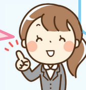
特別支援教育巡回相談員