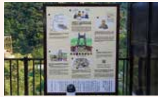
大川橋記念モニュメント