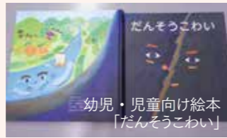
ジオパーク構想推進協議会補助金