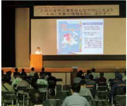
防災シンポジウム 2022 の様子

9月10日開催防災シンポジウム 三好の自然災害を皆でのりこえよう② 過去の大地の動きを知り生かす