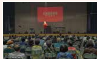
市民文化祭 (北海道歌旅座 ザコンサート 2022)