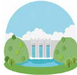
☎ 四国電力 ダム管理所 (☎ 75-2156)

河原に物を置いていないかなど、今一度確認を行って、水による事故や災害の防止に十分ご注意ください。 特に、ダム下流で降雨がない場合でも、ダムの上流流域では強い降雨がある場合、降雨状況により急に水かさが増える場合などもありますので十分ご注意ください。