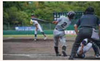
葛文也杯 選抜野球大会