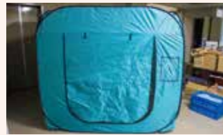
避難所用プライベートルーム