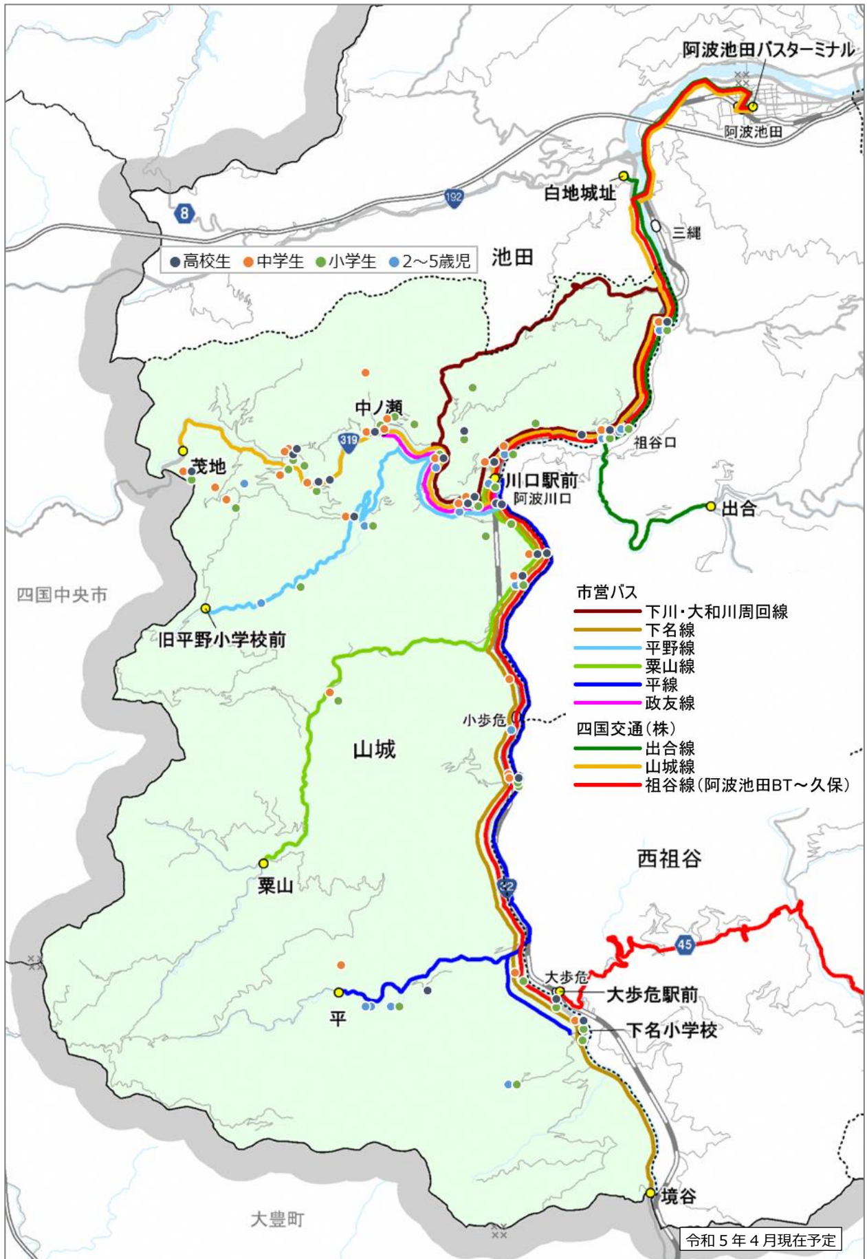
▲小中高生・未就学児(2~5歳)分布