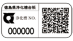
30mm × 60mm

法定検査に伺った(公社)徳島県環境技術センター職員がご案内のうへ、浄化槽付近にステッカーを貼り付けします。