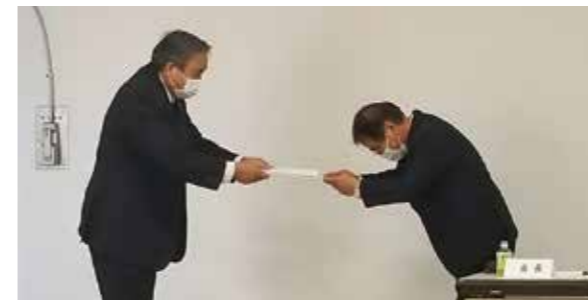
お問い合わせ先 三好市教育委員会 学校教育課 (☎72-3555)

なお、第2期三好市教育振興計画後期計画の詳細は、教育委員会ホームページをご覧ください。