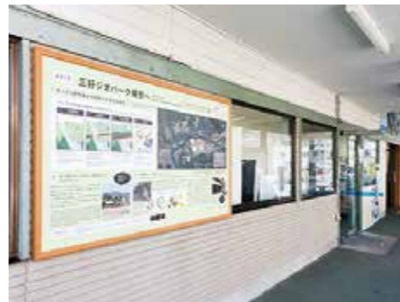
▲ JR 阿波池田駅

そこで、ジオパーク構想地域であることが実感でき、大地の価値や面白さが伝わるよう、4か所に各エリアの概要説明看板を設置しました。設置場所は、「JR阿波池田駅」、「道の駅三野」、「道の駅大歩危」、「道の駅しいや」です。ジオパーク構