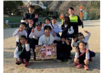
▲ 教室最終日。メッセージが書かれた写真のプレゼントをしました!