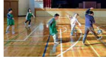
▲ 4v4(サッカー)。ボールを足で操るという慣れない動きをしている時に脳がフル回転しています。

全身の運動機能を養うために、野球とサッカーを基にした2つのスポーツを採用しました。足の運動機能を「4v4」で、それ以外の運動機能を「どか点ティーボール」で養いました。スポーツ教室を通して子どもたちには大変喜んでもらえました。「スポーツをしたい」という願望・需要はたくさんあります。これからもスポーツができる環境を作っていきます。