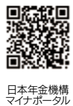
日本年金機構マイナポータル

電子申請にはマイナポータルの開設が必要です。申請後の状況や審査結果は、マイナポータルの申請状況照会ページで確認できます。