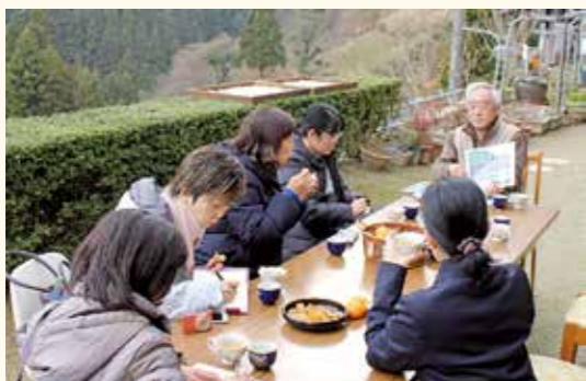
▲日本茶インストラクターが大歩危や有瀬地区を視察

本茶インストラクターの方々が、大歩危の歩危茶・天空ノ山茶、西祖谷山村の有瀬茶の茶畑を見学に訪れました。 日本茶インストラクターは、日本茶に対する興味・関心が高く、日本茶の知識・技術を持ち合わせている指導者の資格で、日本茶の普及活動や茶文化の継承などの活動をしています。 今回の視察は、茶文化の勉強を目的としており、日本全国各地のお茶や茶文化などを見聞しているそうです。三好市の急峻な場所にある茶畑を見た際は、大変驚いており、地域に根付くお茶の文化に対して熱心に聞いていました。三好市のお茶は注目される環境があり、継承していくお茶文化もあると改めて感じました。また、自身の今後のお茶のPRにも「お茶の文化」というものを意識して、活動に励みたいと感じています。