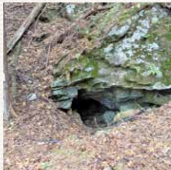
【写真2】腕鉱山跡の坑道入口