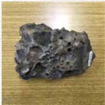
【写真3】祖谷鉱山付近で採取したスラグ（銅を精錬したあとの屑）