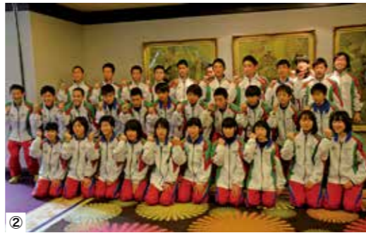
徳島駅伝 1/4 ~ 1/6

①障がいのための国際シンボルマーク 障がい者が利用できる建物、施設であることを明確に表すための世界共通のマークであり、すべての障がい者を対象としたものです。