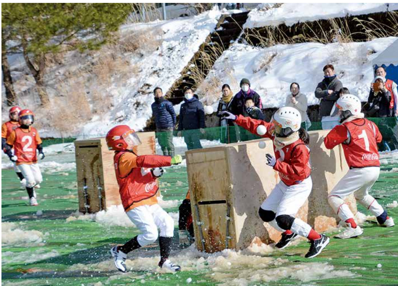
熱戦が繰り広げられた第14回雪合戦四国大会(16Pに掲載)