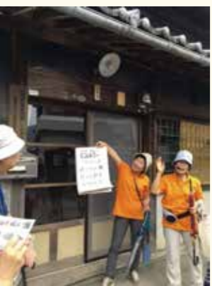
▶井川町辻のまち歩きガイドさんによる辻のまち歩きツアーの様子

講演、2回目は、井川町辻のまち歩きガイドさんによる辻のまち歩きツアーを案内していただき交流を図りました。3回目は西祖谷山村のかずら橋周辺を案内いただき、4回目は管蔵寺アニマルミステリーツアーガイドさんに管蔵寺を案内していただきました。最終回は、観光ガイドの課題を出し合うためのワークショップを行い、今後どのように取り組んでいくかの方向性を見出しました。 セミナーを通じて、ガイド間の交流が深まり、ガイドが抱えるさまざまな課題について共有できたと感じています。今後、出された課題を皆さんと一緒に少しずつ解決できるように取り組んでいきます。 来年度もこの活動は継続していく予定です。観光ガイドに興味のある方に参加してもらい、三好市の観光ガイドのあり方について一緒に考えていきたいと思っています。ぜひ、参加してみませんか？