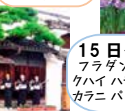
15日ゲスト フラダンス クハイハラウオカレイアヌエヌエオカラニパオラバカヒコ(ラウレア)