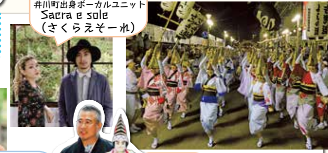
16日ゲスト 井川町出身ボーカルユニット Sacra e sole (さくらえそーれ)