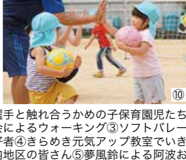
①インディゴソックスの選手と触れ合うかめの子保育園児たち ②山城町老人クラブ連合会によるウォーキング③ソフトバレーボールで交流を深める愛好者④きらめき元気アップ教室でいきいき百歳体操をする野呂内地区の皆さん⑤夢風鈴による阿波おどり教室⑥カローリングを楽しむ参加者⑦参加報告用紙に取り組みを記載する婦人会の皆さん⑧池田総合体育館で卓球⑨三好健康防災公園でパークゴルフ⑩大泉保育園でサッカー教室