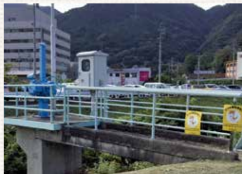
【写真1】池田町シマにある弥十柳川第一樋門