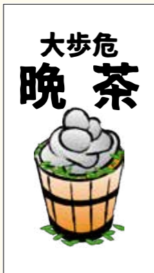
▶大歩危晩茶のパッケージデザイン

私自身も10月22日に「四国まんなかのお茶会」というイベントを開催する予定でしたが、台風の影響により開催することを断念いたしました。楽しみにしていた方や関係者の皆さまにはお詫び申し上げます。また機会があ