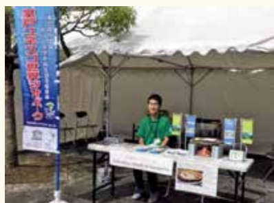
▲ラフティング世界選手権サブ会場でのジオパーク合同ブース

合同ブースには、地域外の方だけでなく以前にジオパークのイベントに出席していただいた地域の方も立ち寄っていただき、合同ブース出展を通してさらなるジオパークの普及啓発活動ができたと思います。